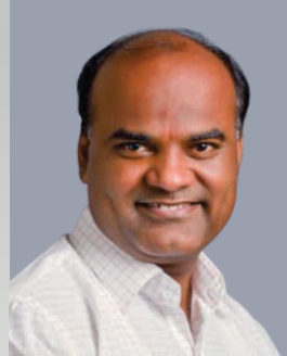
दातखिले बाबासाहेब किसन संचालक