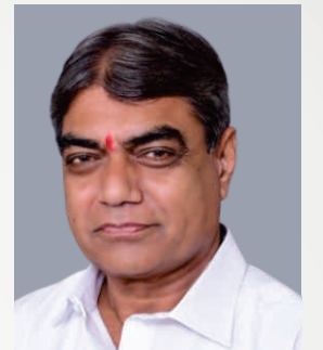
पालवे बाबासाहेब जीवन जनरल सेक्रेटरी