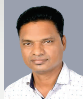
अवचर प्रदिप लक्ष्मण संचालक