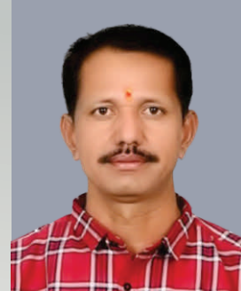
गर्कळ गणेश महादेव संचालक