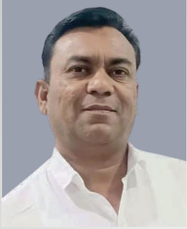
चव्हाण प्रदिप जगन्नाथ संचालक